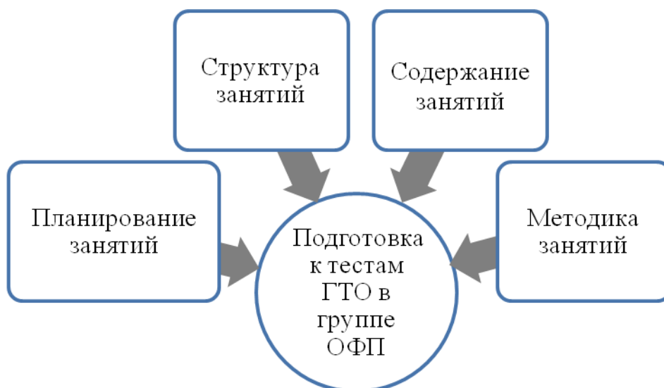
Рисунок 3 – Схема технологии подготовки к испытаниям комплекса ГТО в группе ОФП

Как видно из представленного материала, технология проведения занятий в группе ОФП включает 4 основных компонента: планирование, структуру и содержание занятий, а также методику проведения занятий. Данная технология основывается на следующих принципах подготовки к испытаниям ГТО, таким как: