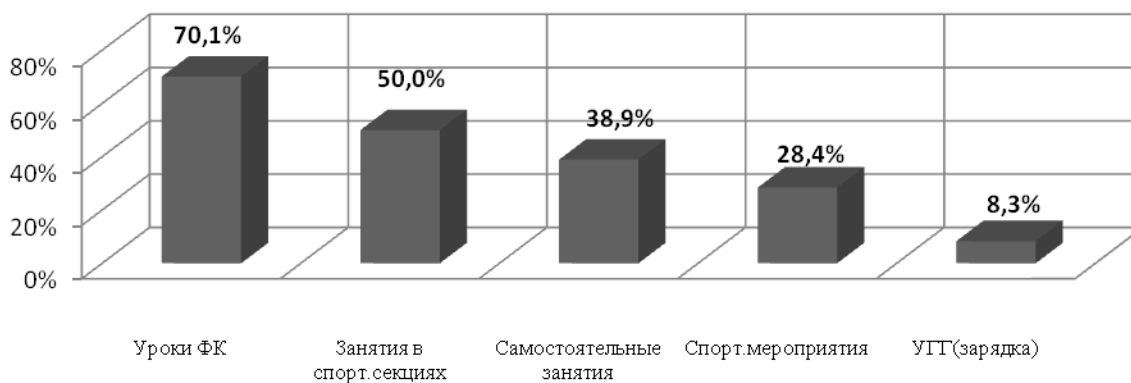
Рисунок 1 - Формы занятий физической культурой, рекомендуемые учителями для подготовки школьников к испытаниям комплекса ГТО

С этой целью был проведен опрос 144 учителя физической культуры Краснодарского края. Полученные при ответе на данный вопрос результаты представлены на рисунке 1.